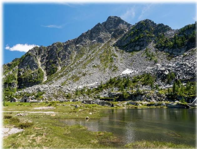
Capanna Starlaresc – Lago Starlaresc – Madom da Sgiòf

... Alcune visuali dai versanti della Valle Verzasca ... nei pressi del nostro itinerario ... ... "Proposte in divenire ... e chi non partecipa ... Sbaglia! ... Sempre!..."