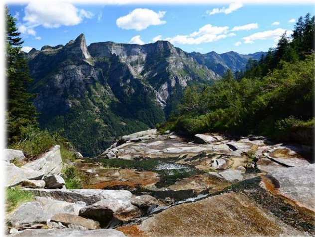
Panoramica. [Poncione d'Alnasca – Cresta della Föpia]