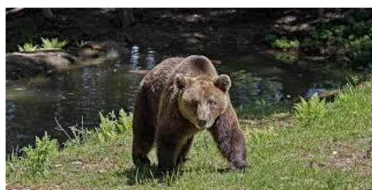
“Osservatorio Eco-Faunistico”. Orso bruno [Ursus arctos]

Dal paese di Aprica, presso l'omonimo valico, inizieremo la nostra escursione attraversando una parte del centro abitato, risalendo la parte iniziale del bosco sino alla località Lische, (Percorso Vita) qui, è ben visibile un sentierino che si raccorda in salita con una pista sterrata ... passo dopo passo ... ne “vinciamo” la salita ... essa, non termina ... ma la pendenza diminuisce sino a raggiungere un punto