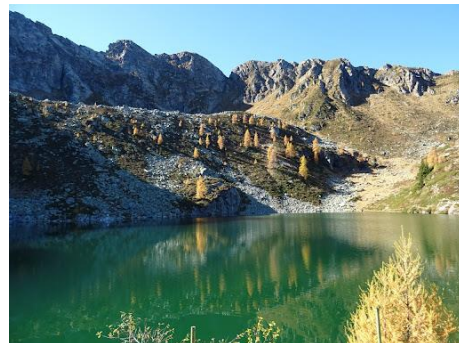
“Conca del Lago Palabione”. (Autunno)

altitudine, dove tra rododendri fioriti e mughete, potremo “liberare” lo sguardo verso le montagne della Valle di Campovecchio, già facenti parte del “comprensorio camuno” ... mentre, per la seconda meta, il Rif. Valtellina, (1920 m s.l.m.) dovremo percorrere una semplice traversata in saliscendi, l'edificio lo raggiungiamo superando il torrente della Val Sorda, questa seconda meta, potrebbe essere l'opzione per rendere ancora più semplice l'escursione ... tutto ciò, lo si potrà fare scegliendo di “abbandonarsi” alle gustose prelibatezze alimentari valtellinesi, ma ... varrà la pena “rinunciare” alla visita della conca alpestre in cui risplende il Lago Palabione? ... Quindi? ... In marcia! ... Dal rifugio, servirà coprire circa un chilometro e superare un dislivello di circa 200 metri, percorreremo un sentiero con alcune facili e brevi ripide sezioni, sempre in vista delle montagne che a Sud racchiudono la conca del lago con un ipotetico arco da Ovest ad Est, comprendenti il Monte Filone, il Dosso Pasò e l'arcigno profilo del Monte Palabione, il Lago Palabione è posto a 2109 metri in una amena conca alpestre ed è contornato da uno scenografico e rado lariceto.